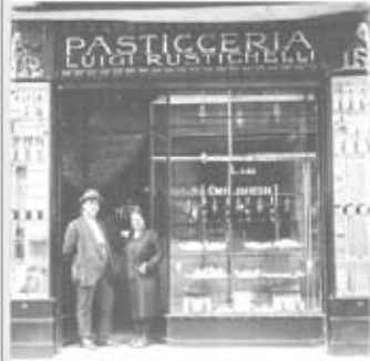
RUSTICHELLI BANQUETING DAL 1919

Pranzi di nozze Rinfreschi per ogni occasione Bar/Bat Mitzvah' Colazioni di lavoro Servizi in fiera Cene a casa tua