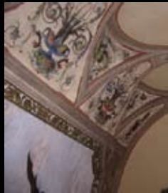
Beirama - Affreschi in casa privata

• RESTAURO CONSERVATIVO SUPERFICI ESTERNE (Facciate, Portali e Statue)