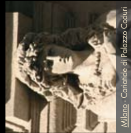
Milano - Cariatide di Palazzo Coduri

• RESTAURO CONSERVATIVO D'INTERNO (Apparati Decorativi e Affreschi)