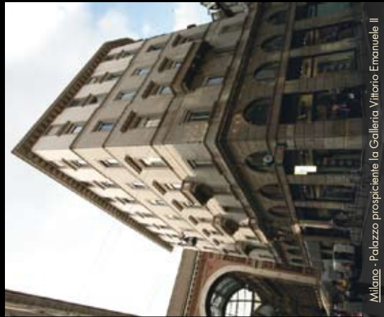
Milano - Palazzo prospiciente la Galleria Vittorio Emanuele II

Specializzata nel campo del Restauro Conservativo di Monumenti, Luoghi Sacri, Palazzi e Castelli, da oltre 50 Anni operiamo nel settore con una struttura flessibile e di lunga tradizione. Per il Restauro di edifici civili, proponiamo una metodologia "non invasiva" tipica del Restauro d'Arte. Durante la fase di pulitura prediligiamo lavorazioni manuali: "ad impacco" (a base di galatina e con il minimo utilizzo di acqua), SENZA SABBIARE GARANTIAMO A PASSANTI E CONDOMINI IL MINOR DISTURBO.